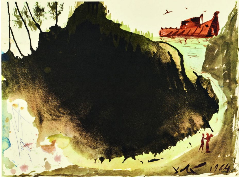
Abb. 3 Salvador Dalí , Die Sintflut, Bild Nr. 10 aus dem Zyklus der „Biblia Sacra“, 1963–1965. © Fundació Gala-Salvador Dalí / VG Bild-Kunst, Bonn 2023; Foto: 4r3p sporrer&rupp fotografie