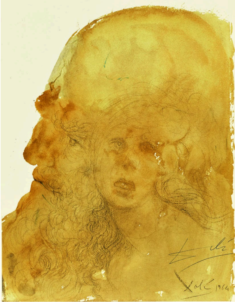
Abb. 6 Salvador Dalí , Die Liebe des Artaxerxes zu Ester, Bild Nr. 34 aus dem Zyklus der „Biblia Sacra“, 1963–1965.