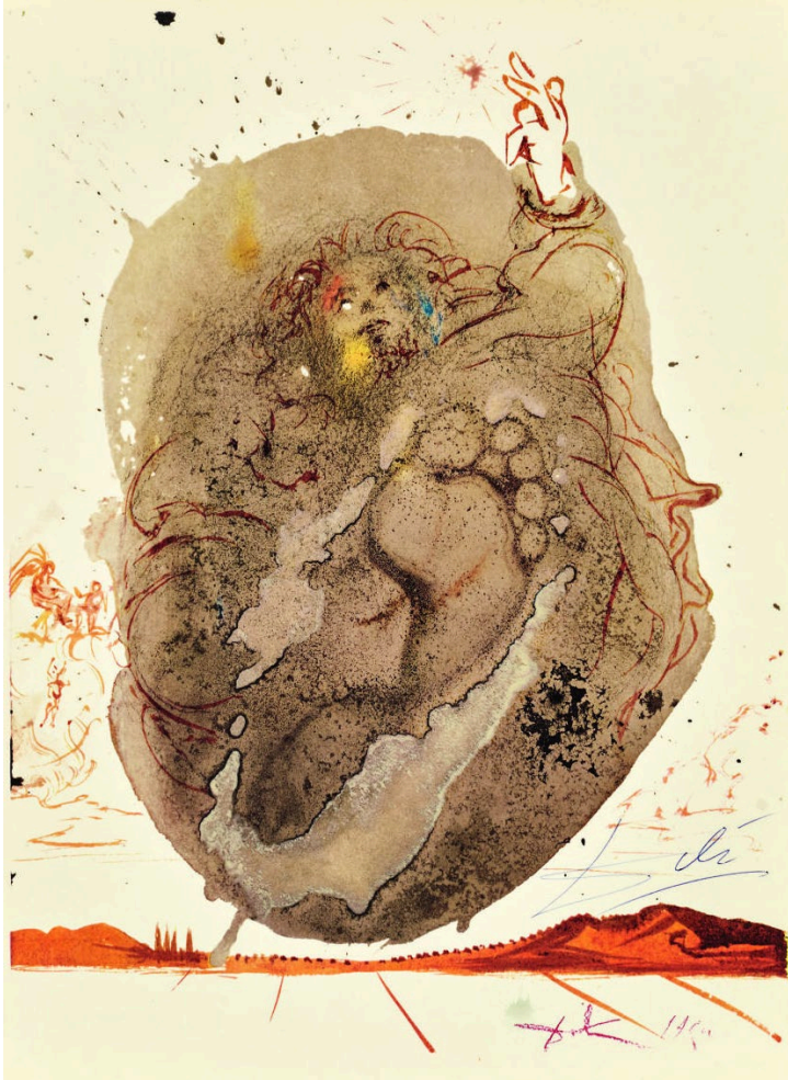
Abb. 1 Salvador Dalí , Die Erschaffung des Menschen, Bild Nr. 5 aus dem Zyklus der „Biblia Sacra“, 1963–1965.