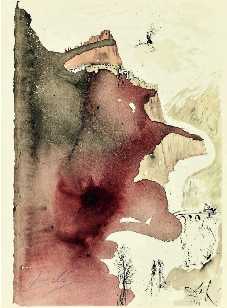
Abb. 4 Salvador Dalí , Die Taufe Jesu im Jordan, Bild Nr. 71, aus dem Zyklus der „Biblia Sacra“, 1963–1965. © Fundació Gala-Salvador Dalí / VG Bild-Kunst, Bonn 2023; Foto: 4r3p sporrer&rupp fotografie