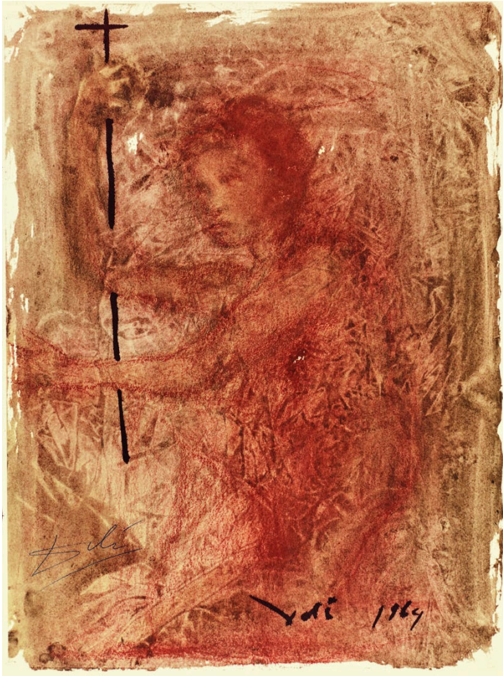
Abb. 7 Salvador Dalí , Johannes der Täufer, Bild Nr. 68 aus dem Zyklus der „Biblia Sacra“, 1963–1965. © Fundació Gala-Salvador Dalí / VG Bild-Kunst, Bonn 2023; Foto: 4r3p sporrer&rupp fotografie