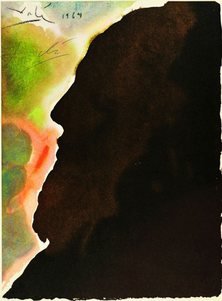
Abb. 5 Salvador Dalí , Abraham Vater vieler Völker, Bild Nr. 13 aus dem Zyklus der „Biblia Sacra“, 1963–1965. © Fundació Gala-Salvador Dalí / VG Bild-Kunst, Bonn 2023; Foto: 4r3p sporrer&rupp fotografie